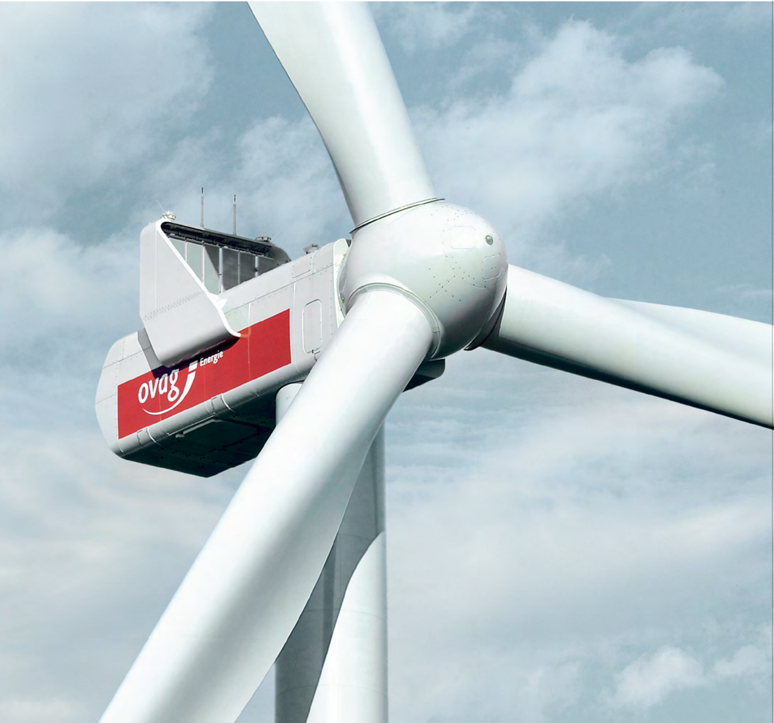
WIND. STÄRKE. Eine Vestas V-126 mit 3,3 MW Nennleistung im Windpark Gedern.