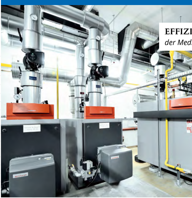
EFFIZIENT: Die Heizanlage der Median-Klinik Schlagenbad.