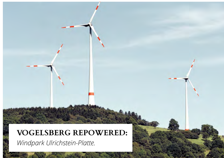
VOGELSBERG REPOWERED: Windpark Ulrichstein-Platte.

Repowering der Ulrichstein-Platte. Ulrichstein im Vogelsberg ist der Standort zweier Windparks, die wir 1994 und 1996 bauen konnten. 2009 begann das in Hessen bislang umfangreichste Repowering-Projekt unter unserer Führung. Dreizehn technisch veraltete Windenergieanlagen wurden zurückgebaut und durch sieben moderne Anlagen mit je 2,3 Megawatt Nennleistung, Rotordurchmessern von 82 Metern und einer Nabenhöhe von 138,4 Metern ersetzt. Die früheren Anlagen hatten eine Nennleistung von je 225 kW und eine Nabenhöhe von 36 Metern. Die Stromproduktion konnte bei gleichem Flächenbedarf versechsfacht werden und pro Jahr werden ca. 28.000 Tonnen klimaschädlicher CO 2 -Emissionen eingespart.