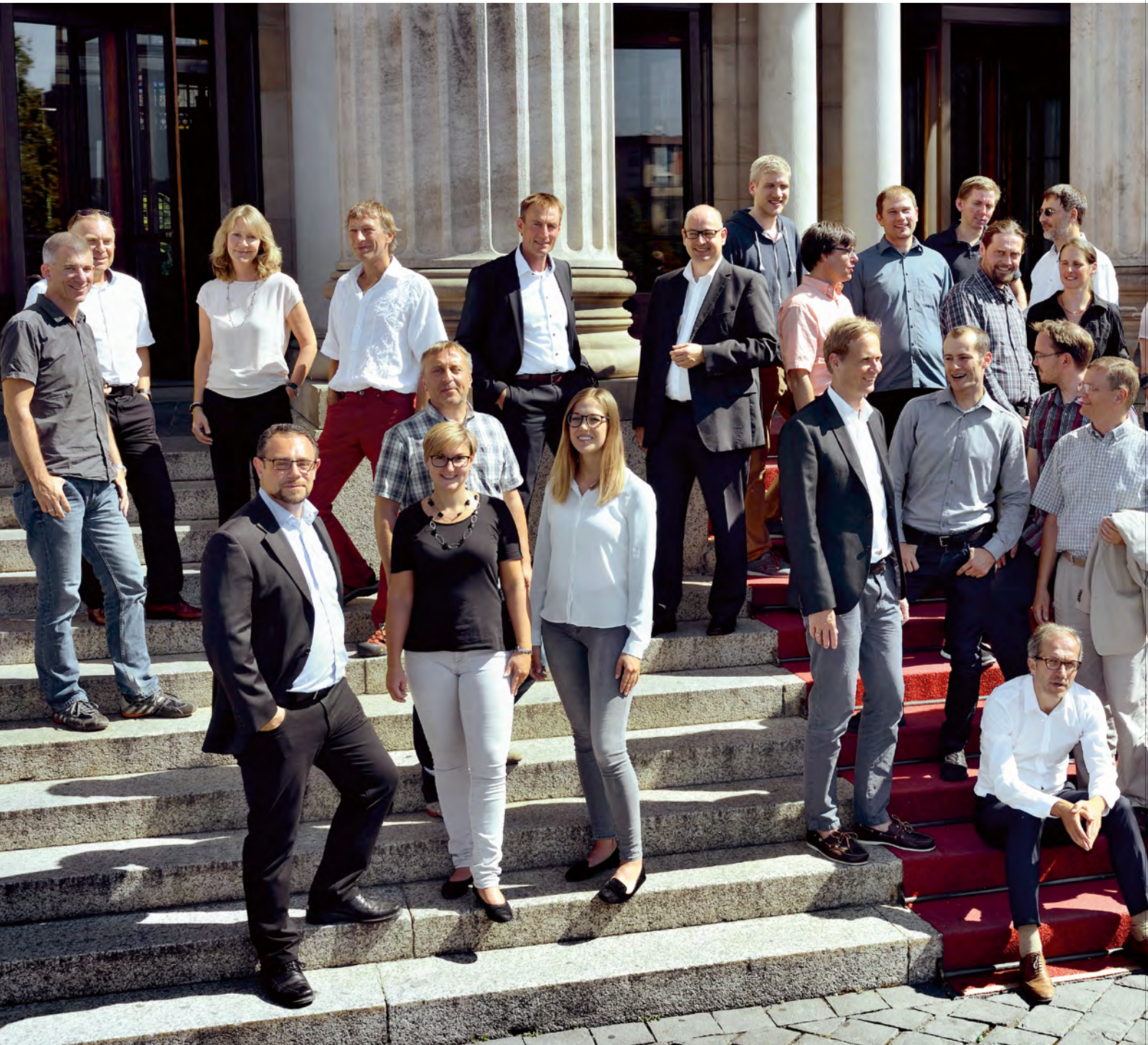
WIR GESTALTEN EFFIZIENZ. Das Team der HessenEnergie für die Geschäftsbereiche: Consulting & Beratung // Energieliefer- & Einspar-Contracting // Errichtung und Betrieb von Energieanlagen für Dritte.