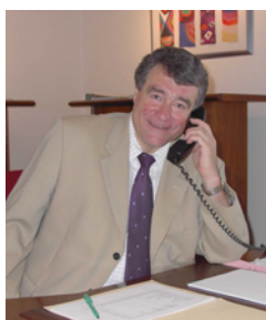
Bürgermeister Norbert Leber

Vertragsjahr betrug die Einsparung mit 81.490 EUR rund 11 % der Jahresenergie- und Wasserkosten. Auch zukünftig wird die Fortführung des Energiemanagements durch die Verwaltung jährlich eine Entlastung des Haushalts bewirken und gleichzeitig einen Beitrag zum Klimaschutz leisten.