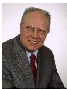
Bürgermeister Wilhelm Kreß

rung, inklusive der Effekte laufender Instandhaltung, in Höhe von 41.624 EUR erzielt. Im letzten Vertragsjahr betrug die Einsparung mit 20.530 EUR rund 6,6 % der Jahresenergie- und Wasserkosten. Auch zukünftig wird die Fortführung des Energiemanagements durch die Verwaltung jährlich eine Entlastung des Haushalts bewirken und gleichzeitig einen Beitrag zum Klimaschutz leisten.