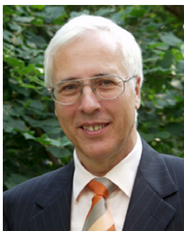
Landrat Enno Siehr

Darüber hinaus verfügt die Anlage über eine Datenfernüberwachung, so dass Störmeldungen ausgegeben werden und die Anlage jederzeit kontrolliert werden kann.